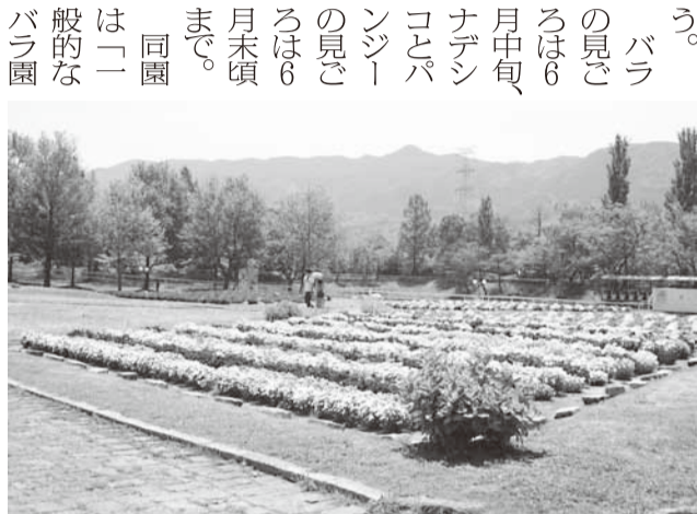
セントラルガーデンのナデシコとパンジー

平日午前10時～午後5時、土日祝は午前9時～午後5時。水曜日休園。入園料大人1500円、子ども(4歳～小学生)800円。問い合わせは同園(☎074-801-5212)へ。