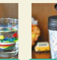
タンブラー絵付け