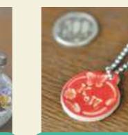
キーホルダー丸型