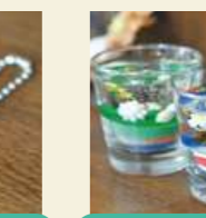
クリアキャンドル