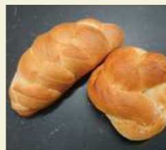
お手軽ミルクパン&バター作り